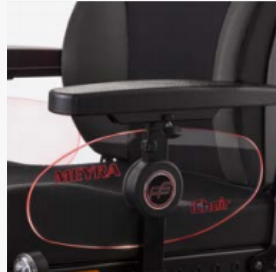
Seitenteilbeleuchtung mit individueller Gravur