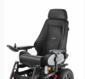
Recaro-Sitz in schwarzem Kunstleder