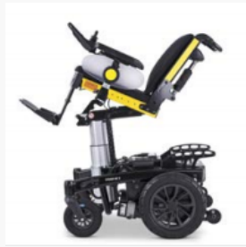
200 mm Sitzhub, Kantelung