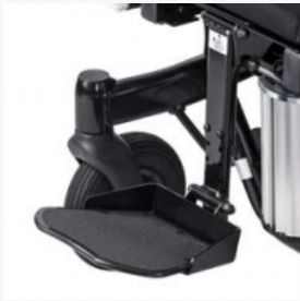
Zentrale Beinstütze, 90° Kniewinkel