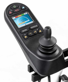
Χειριστήριο R-NET με έγχρωμη οθόνη LCD