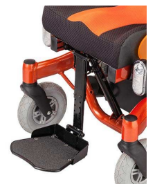
Κεντρικό μονό υποπόδιο (επιλογή)