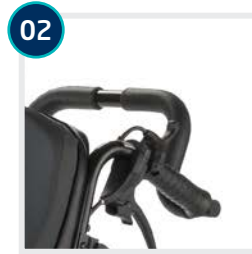
Artikel 1080609/ 1080611